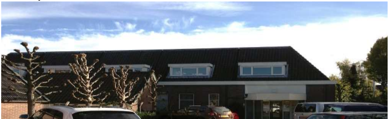
fig.8 De Molenberg anno 2013

Naast haar alledaagse primaire activiteiten richt Van Kappel Security Solutions zich sedert de afgelopen 10 jaar op het afnemen van vingerafdrukken voor particulieren en bedrijven.