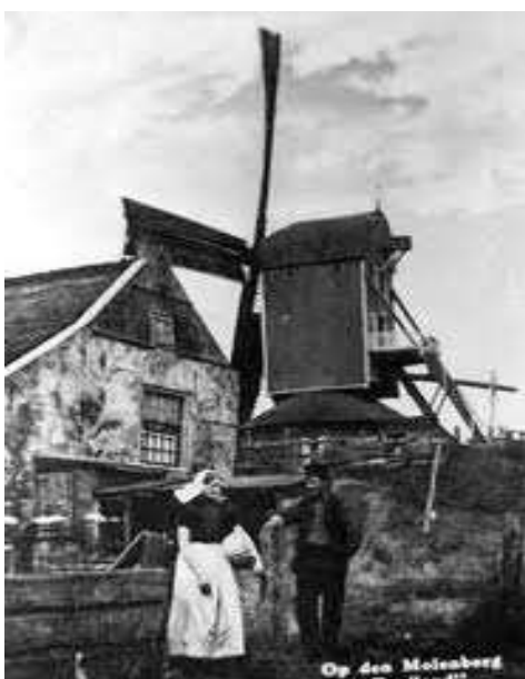
fig. 9 De Molenberg anno 1900

Van Kappel Security Solutions BV is gevestigd in het centrum van het in 't Gooi gelegen vissersdorpje Huizen, ongeveer dertig kilometer zuidoostelijk van Amsterdam. Het kantoorpand "de Molenberg" is vernoemd naar de molen die in vroeger tijden op deze hoogste plaats van Huizen stond.